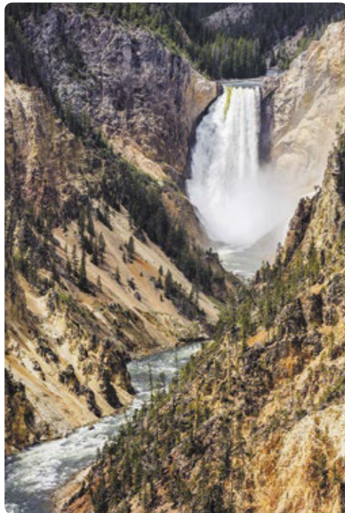
Lower Falls, Yellowstone National Park

veroorzaakt door overstekend wild. Bisons, rendieren, coyotes en zelfs grizzlyberen laten zich regelmatig op of langs de weg zien; een mooi fotomoment! ☼ 200 mijl naar Grant Village ★ De Old Faithful geiser dankt zijn naam aan het feit dat hij trouw elke 90 minuten uitbarst. De Lower Yellowstone Falls zijn ruim twee keer zo hoog als de Niagara-watervallen.