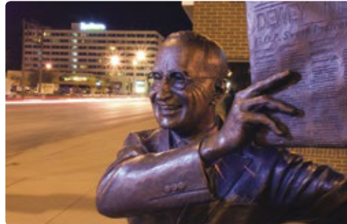
Rapid City, the City of Presidents

indianenleider Crazy Horse. Er wordt nog steeds aan gebouwd, eenmaal klaar zal het 170 meter hoog en 195 meter lang zijn. 150 mijl naar Badlands National Park via Mount Rushmore ★ Neem de Iron Mountain Road en de Needles Highway voor de mooiste uitzichten. Eindig uw dag met een zonsopgang boven de heuvels en canyons van Badlands National Park. https://foreverresorts.rzda.net/cedarpass/