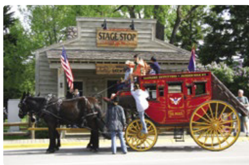
Met de postkoets... Jackson

Dag 13/14 > Slechts een korte rit vanaf de zuidelijke ingang van Yellowstone National Park brengt u in Grand Teton National Park, waar de majestueuze Teton-bergen, deel van de Rocky Mountains, het landschap bepalen. Jackson, aan de rand van het park, is een modern plaatsje, maar het ademt ook nog echt een westernsfeer. Toegangsbogen, gemaakt van elandgeweien, markeren de ingang van het park middenin het