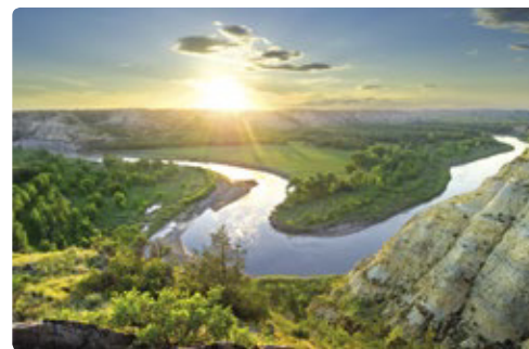
Theodore Roosevelt National Park

Dag 5/6 > De lange, maar eenvoudige rit naar Medora in North Dakota is de moeite zeker waard. Zijn tijd als veehouder in deze staat legde de basis voor Theodore Roosevelt's inspanningen voor het oprichten van de National Park Service. U kunt een bezoek brengen aan het park dat zijn naam draagt en dat wordt bewoond door vele bizens, wilde paarden, elanden en steenarenden. 250 mijl