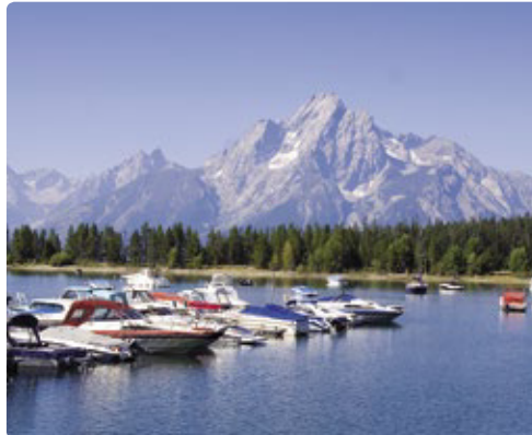
Colter Bay, Grand Teton NP

centrum, terwijl u aan de houten trottoirs talloze winkels vindt. ☼ 40 mijl naar Colter Bay Village RV Park ★ Rijd de 42 mijl lange Scenic Loop door het park voor het ene adembenemende uitzicht na het andere. Breng 's avonds een bezoek aan de Milion Dollar Cowboy Bar, waar de barkrukken echte zadels zijn.